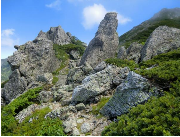
奇岩竹内門の岩 (近づくと線がたくさんはいつているのが分かります。)